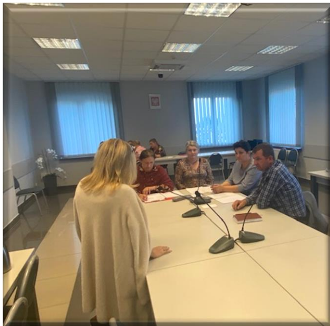
Grupa odnowy wsi w czasie warsztatów opracowania Sołeckiej Strategii Rozwoju