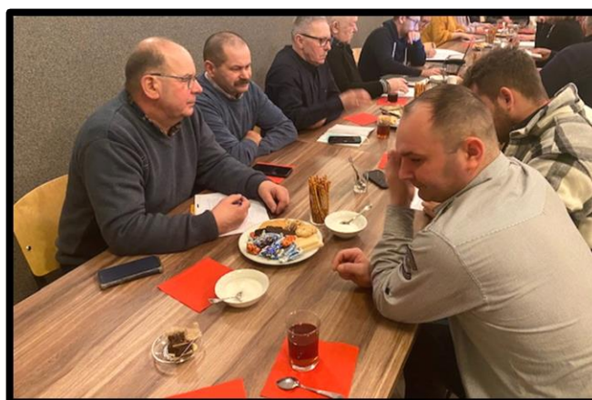
Grupa odnowy wsi w czasie warsztatów opracowania Sołeckiej Strategii Rozwoju

SOŁECKA STRATEGIA ROZWOJU dla sołectwa Kowale Pańskie Kolonia wypracowana przez GOW na warsztatach w ramach programu UMWW - „Wielkopolska Odnowa Wsi 2020+”