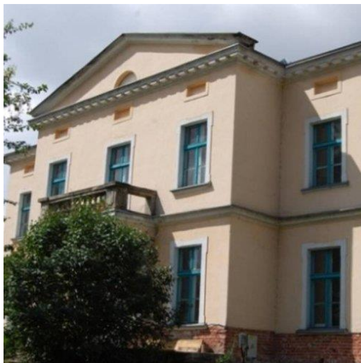
Dworek w Chocimiu

W Chocimiu występuje pomnik przyrody. Jest to okazały, stary wiąz szypułkowy mający 310 cm obwodu, a jego nazwa – Chocimierz – została wybrana przez uczniów Szkoły Podstawowej w Tokarach Pierwszych, podczas specjalnie zorganizowanego konkursu.