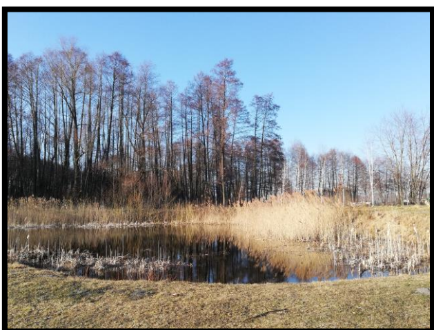
Staw na działce gminnej