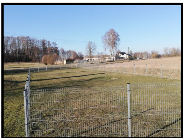
Działka gminna pod plac zabaw