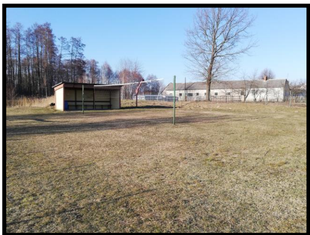
Działka gminna z boiskiem do siatkówki i kosza