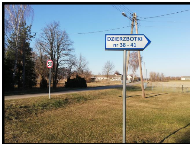
Droga gminna i tabliczki z numerami posesji