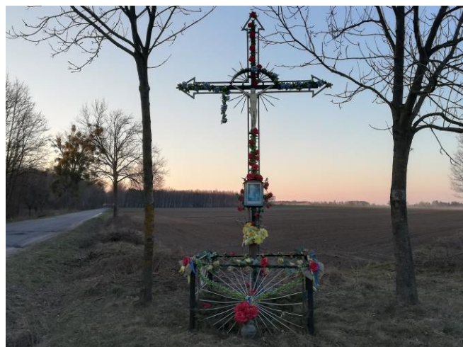
Tablica informacyjna i krzyż przydrożny