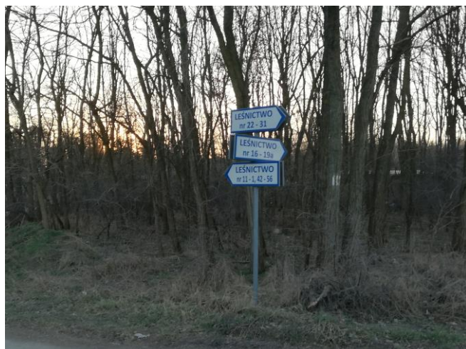
Tablica ogłoszeń i tabliczki z numerami posesji