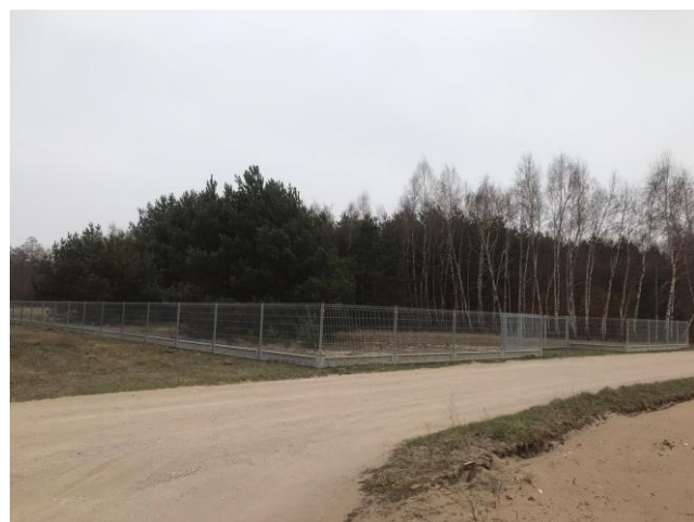
Działka sołecka – teren pod zagospodarowanie