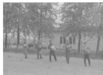
Sianie trawy na terenie boiska 1985 rok

Młodzież zorganizowała się w lokalny klub sportowy. Na potrzeby tego klubu powstało w latach 80-tych boisko wiejskie. W 1993 roku mieszkańcy w czynie społecznym i ze środków Rady Soleckiej utwardzili i ogrodzili teren oraz zamontowali ławki i bramki. 7 października 2009r. rozpoczęto inwestycję pn.: ”SPRAWNI JAK NASI DZIADOWIE – PRZEBUDOWA BOISKA SPORTOWEGO W TOKARACH PIERWSZYCH”. W 2010 roku przeprowadzono prace remontowe boiska w wyniku prowadzonych działań powstał budynek zaplecza socjalno - sanitarnego, wybudowane zostały trybuny ziemne oraz zbiornik na ścieki. Inwestycja w 75% współfinansowana była ze środków Samorządu Województwa Wielkopolskiego na podstawie umowy o przyznanie pomocy w ramach działania „Odnowa i rozwój wsi” objętego PROW na lata 2007-2013, zawartej w dniu 19.10.2009 r. w Urzędzie Marszałkowskim Województwa Wielkopolskiego w Poznaniu. Na boisku odbywają się wszystkie lokalne imprezy: festyny rodzinne, zawody sportowo – pożarnicze, przeglądy orkiestr dętych i dożynki.