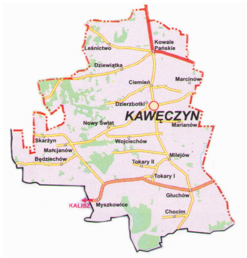
Położenie Tokar Pierwszych na mapie Gminy Kawęczyn

Na terenie gminy osiedlił się bocian czarny – co stanowi niezwykle wydarzenie ornitologiczne, gdyż jest to gatunek bardzo rzadki i płochliwy. Przez gminę nie przebiega żadna czynna linia kolejowa. Gmina Kawęczyn jest członkiem – założycielem Lokalnej Grupy Działania Turecka Unia Rozwoju T.U.R.