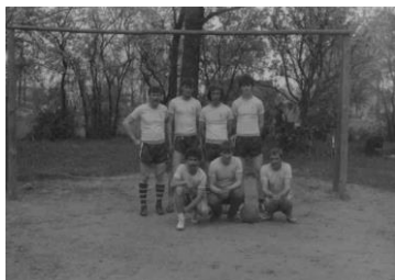
Reprezentacja Tokar, liga gminna pod patronatem Rady Wojewódzkiej Zrzeszenia LZS w Koninie

Integralną częścią Tokar Pierwszych jest boisko sportowe. Tradycje sportowe istniały wśród mieszkańców wsi „od zawsze”.