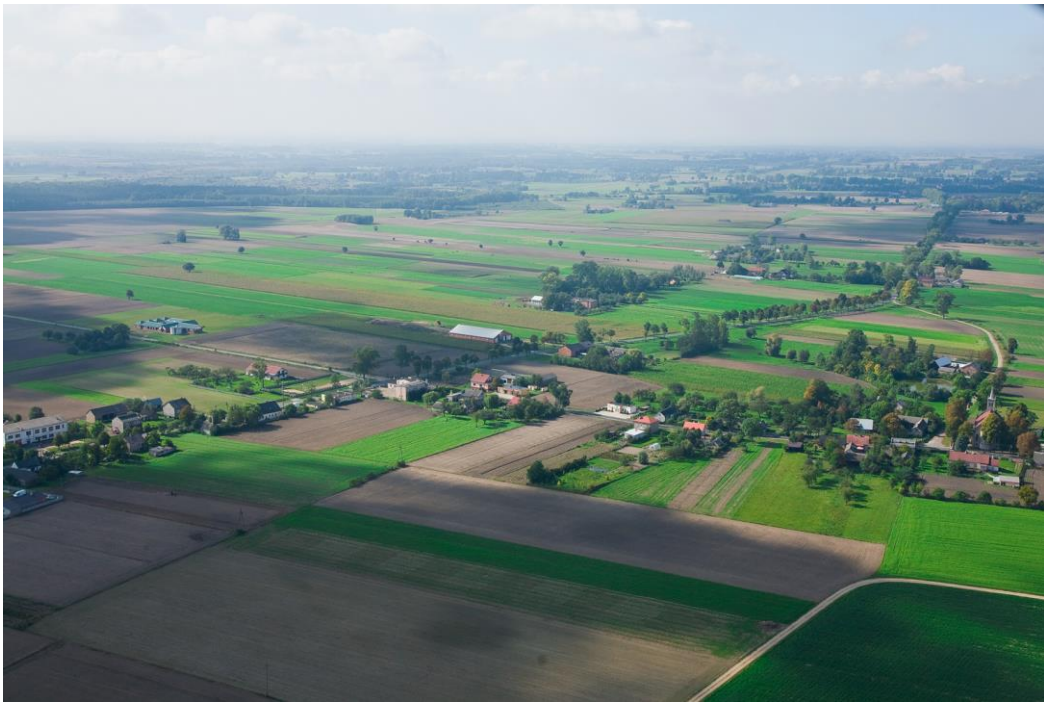
Tokary Pierwsze, 2022 r.