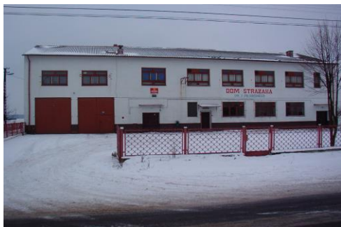
Dom Strażaka w Tokarach Pierwszych

Funkcjonuje tu również Filia Gminnej Biblioteki Publicznej. Przy szkole działa Stowarzyszenie Rodziców i Przyjaciół Szkoły w Tokarach, które organizuje pikniki rodzinne, warsztaty edukacyjne, imprezy środowiskowe, Festiwal Piosenki Dziecięcej „Śpiewaj Razem z Nami” i wycieczki.