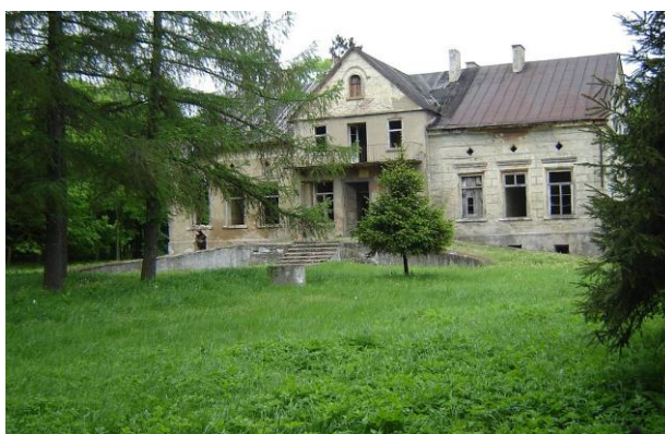
Dwór rodziny Młodeckich

Spółeczeństwo Żdźzar jest raczej aktywne i zorganizowane. Chętnie uczestniczy we wspólnych spotkaniach, festynach i imprezach.