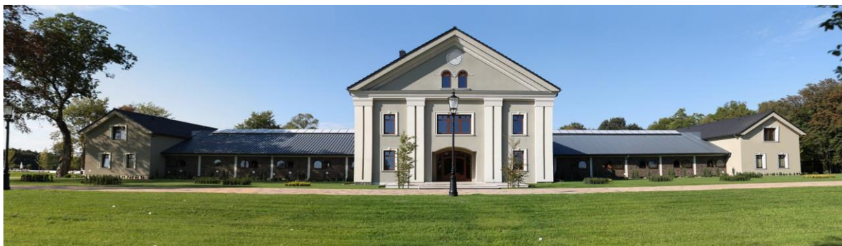
Stadnina Koni Hea