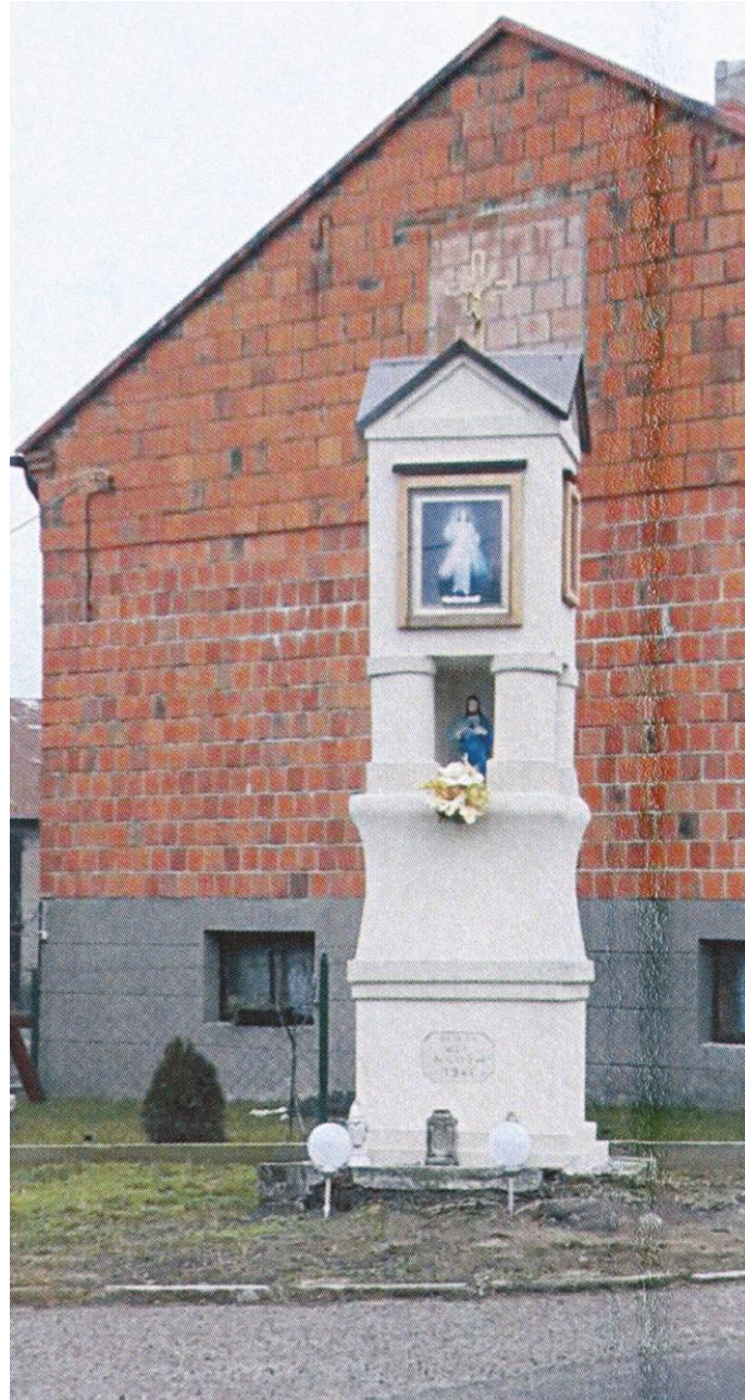
Kapliczka w Milejowie